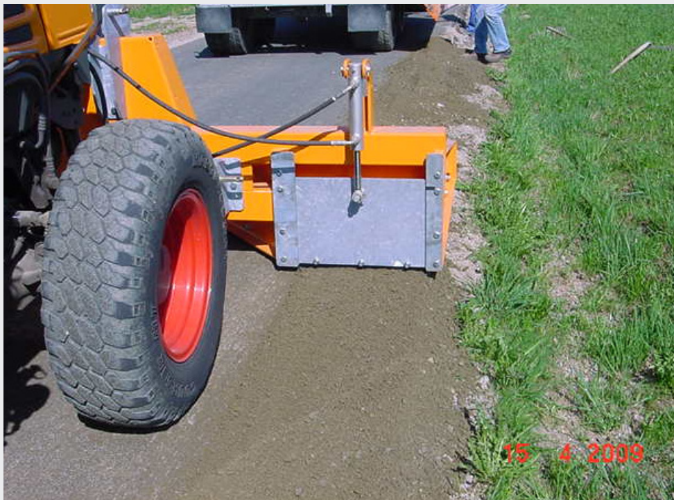
Durch den höhenverstellbaren Schieber wird die notwendige Überhöhung für die Verdichtung eingestellt.