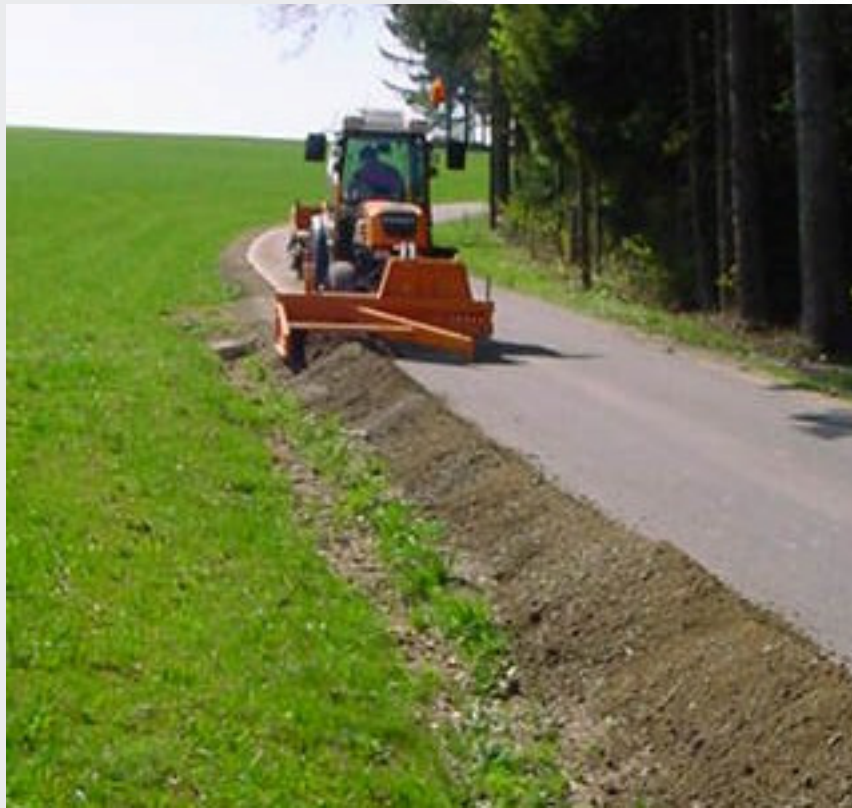
Anbau an Schmalspur- oder Standardtraktoren durch verstellbare Anbaukonsolen