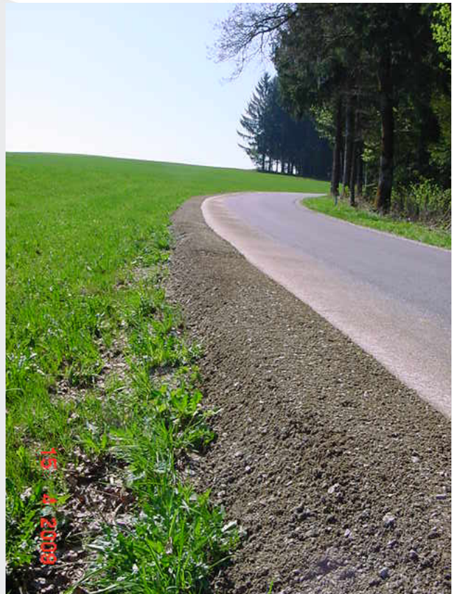
fertiges Bankett ohne Verdichtung